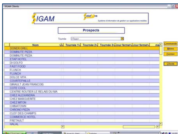
Gestion des prospects