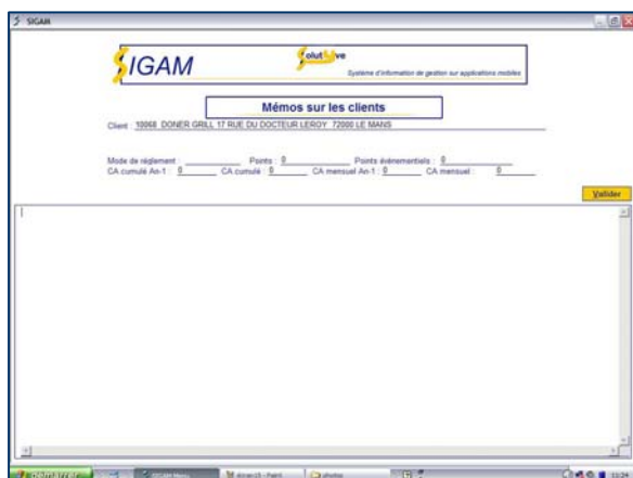
Notes sur les clients